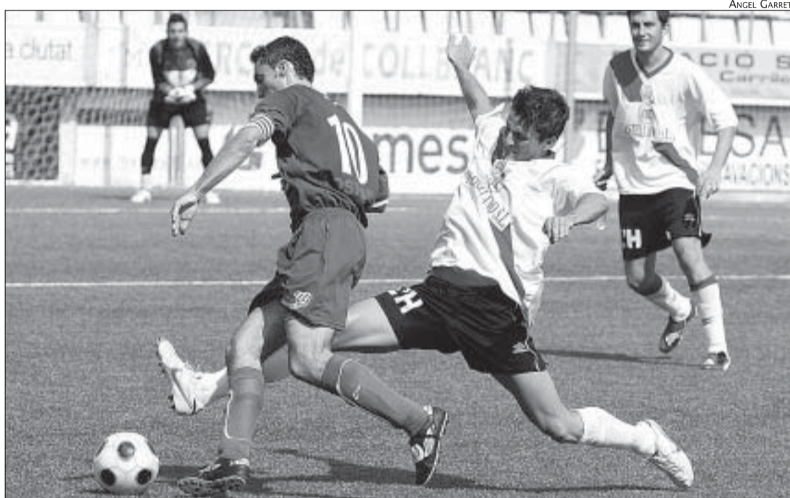
UNA JUGADA DEL PARTIT L'HOSPITALET - EUROPA DE LA PRIMERA VOLTA DE LA LLIGA

L'Europa i l'Hospitalet es veuran les cares aquest diumenge a les dotze al Nou Sardenya en un partit inusual, ja que els tres punts de l'enfrontament de la primera volta encara resten pendents d'assignació definitiva, es troben encara en mans del comitè de competició de la federació estatal. La participació d'un jugador sense fitxa per part dels del Baix Llobregat va fer que la federació catalana donés la victòria per 0 a 3 als graciencs, decisió que va tirar enrere el comitè espanyol mantenint el 2 a 0 que reflectia el marcador final del matx. Després del recurs presentat pel club de la Vila, ara s'espera que al març o a l'abril, es doni a conèixer el propietari dels 3 punts. En aquest context arriba l'Hospitalet líder del grup 5 de Tercera al que es convertirà en