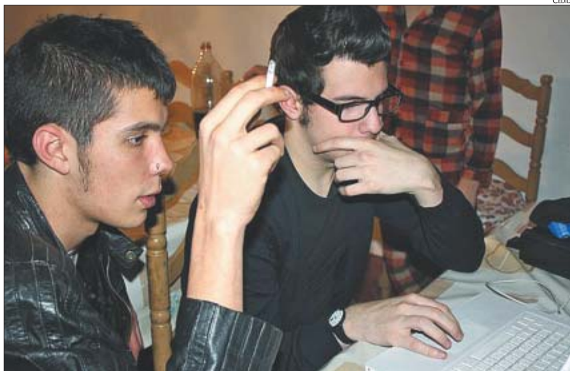
L'EQUIP DE 'WEEKEND' TREBALLANT EN EL MUNTATGE D'UN DELS CAPÍTOLS DE LA SÈRIE

Als membres de l'equip de la sèrie Weekend , amb centre neuràlgic a l'IES Vila de Gràcia, els va tocar dijous trencar el gel. I ho van fer amb la projecció, per primer cop en pantalla gran, de La multa , el segon dels capítols d'aquesta sitcom , en el qual els sis joves protagonistes decideixen rodar una pel·lícula porno per poder fer front a una multa per consum de cànnabis sense haver de donar explicacions a ningú. El responsable