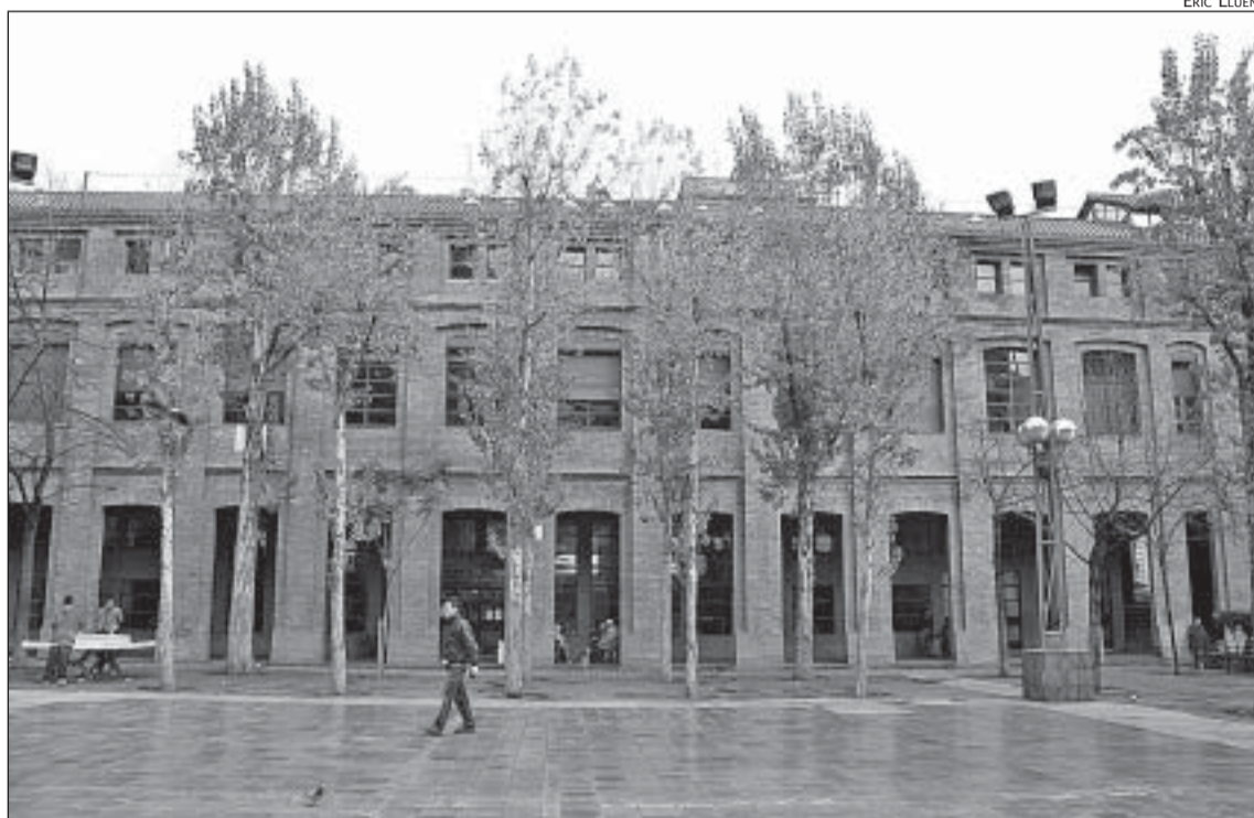
VISTA INTERIOR DE LA PLAÇA DE LA SEDETA