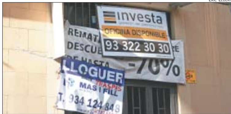
BOTIGUES DE LA TRAVESSERA QUE ANUNCIEI EL SEU TANCAMENT

Caminar aquests dies per les principals vies comercials de Gràcia és sinònim de cartells de rebaixes i molts altres dels que anuncien la baixada de la persiana definitiva de força botigues i la liquidació total dels seus estocs. La crisi del 2009 s'ha traduït, després de la campanya de Nadal i els descomptes de gener, en un alt índex de tanca-