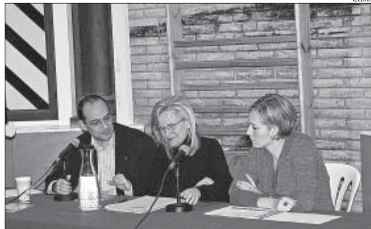
UN MOMENT DE LA SESSIÓ DEL PLA COMUNITARI DE LA SALUT

peració dels jardins d'Àustria o la incorporació d'àrees infantils en punts com el carrer Farigola. La inversió prevista per a aquest bienni és de 4,8 milions d'euros i el punt més polèmic és, sens dubte, el del tancament de la zona monumental. Una restricció de la qual, com va apuntar Mayol, quedaran exempts els veïns dels barris colindants al parc, però no els de la resta del districte. L'ob-