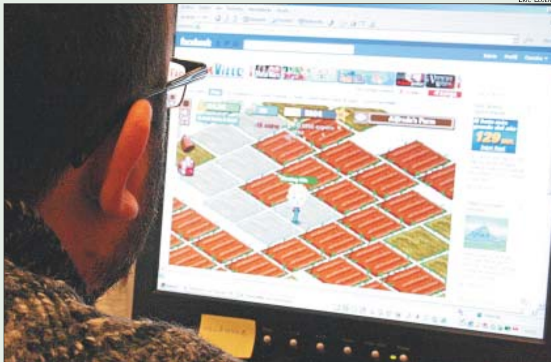
EL JOC ES DIU FARMVILLE I L'OBJECTIU DEL JUGADOR ÉS VIURE LA BONA VIDA