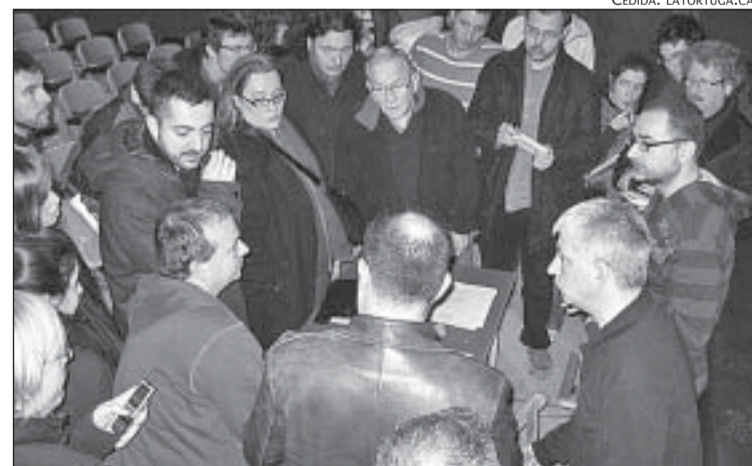
LA REUNIÓ CONSTITUTIVA DE DISSABTE PASSAT A LA SEU DE LLUÏSOS