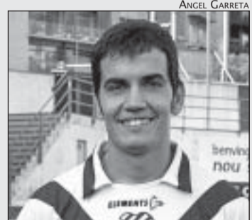
IMATGE OFICIAL DEL JUGADOR ESCAPULAT

Que vinguin com ho fan cada setmana. I que segur que la seva empena i suport serà un plus per a nosaltres.