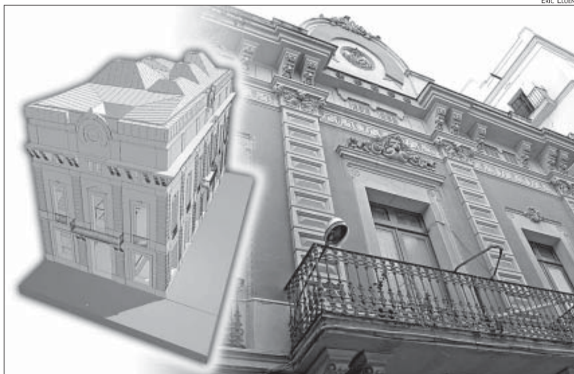
L'ESTAT ACTUAL DE LA VIOLETA I LA SIMULACIÓ DEL NOU EQUIPAMENT

La reforma de l'antic casino, que segueix el projecte V de Violeta dels arquitectes Miquel Alonso i Joan Milelire, ja té projecte bàsic i calendari per tornar a obrir portes amb tres plantes i els interiors renovats. La previsió municipal és disposar del projecte executiu a curt termini i poder començar les obres al juliol o, a molt estirar, al setembre. La reforma conservarà elements identitaris de l'antic casino, com la façana o el bar i també l'esperit del que era el teatre. Aquest espai, però, es modernitzarà amb elements de sala d'actes i reduirà les seves dimensions, com a conseqüència de la construcció de la nova planta, que obligarà a retirar les llotges. A més a més la nova sala també serà una mica més estreta i baixa que l'actual. Tal i com estava previst en el primer projecte, a la nova plan-