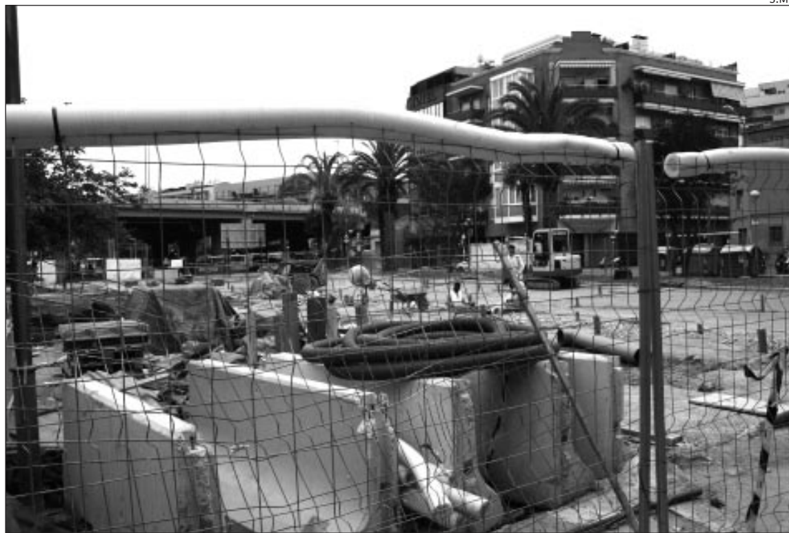
OBRES DEL MERCAT PROVISIONAL AL PARC ROSA SENSAT, AL COSTAT DE LA C-31

Aquest espai se situarà al carrer de Santa Caterina, al costat del CEIP Pompeu Fabra i davant de la plaça de Rosa Sensat, una ubicació que l'ajuntament ha qualificat de "molt interessant per la proximitat a la ciutadania i a l'antic Mercat". Per aquest motiu s'ha modificat la mobilitat dels vehicles del carrer de Santa Caterina, eliminant provisionalment dos carrils. Tot i així, s'habilitarà un carril en sentit contrari al mateix carrer per al pas bidireccional de vehicles, amb l'objectiu de garantir la correcta fluïdesa del trànsit. El mercat provisional disposarà de totes les infraestructures necessàries per al desenvolupament òptim de la seva activitat comercial. L'oferta sumarà un total de 29 parades; concretament 7 de fruita i verdura, 5 de productes càrnics, 5 de peix i marisc, 3 de pollastre, 3