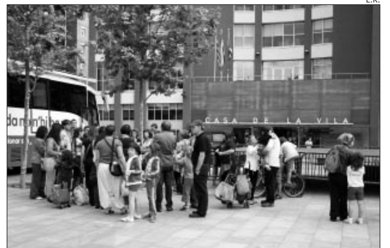
CONCENTRACIÓ A LA PLAÇA DE LA VILA EL PASSAT DIMECRES 1 DE JUNY