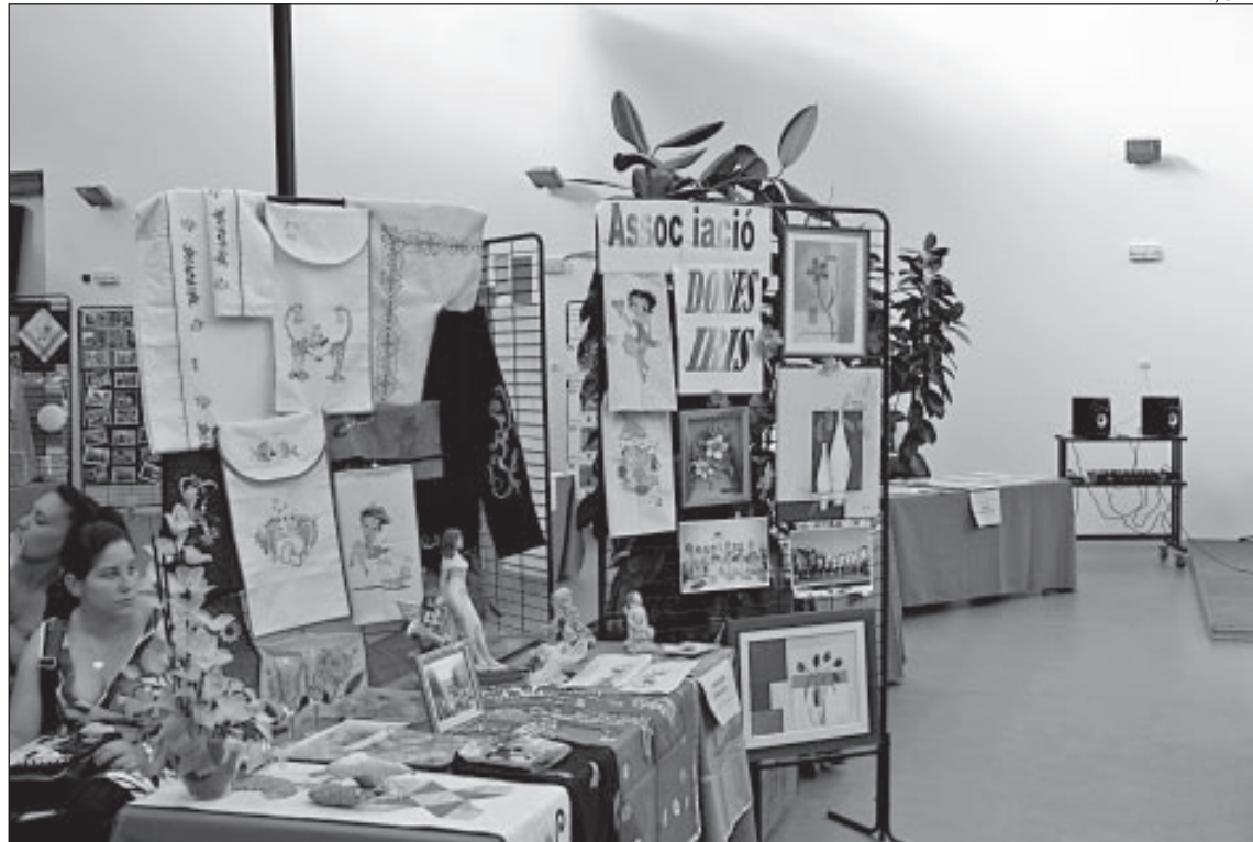
UNA IMATGE DE LA SETMANA CULTURAL DE 2010 AL CENTRE FONT DE LA MINA

Després de 20 anys de lluita, i tot i la influència negativa de la crisi, la XX edició de la Setmana Cultural de la Mina ha estat possible gràcies a la voluntat de la gent. Quan cap als anys 80 i 90 va començar aquesta iniciativa, no es podia parlar que fos tasca fàcil, doncs el barri es trobava en una situació molt preocupant. Si més no, amb el temps, la Mina s'ha anat desenvolupant. Per a aquest motiu, la Plataforma i l'Associació de veïns van negar-se a deixar en l'oblit un projecte cultural tant potent com aquest. Enguany, gràcies a la col·laboració d'entitats, col·lectius i serveis, la Setmana Cultural tindrà lloc novament amb un seguit d'activitats molt variades. El dia 7, comença