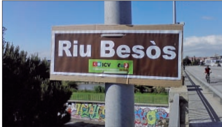
EL NOU CARTELL PER A SENYALITZAR EL RIU

ICV-EUiA Sant Adrià va sortir al carrer el passat 15 de maig amb l'objectiu "d'acabar amb la situació que afectava al Riu Besòs al pas per la població". Fins aleshores, feia temps que en els ponts que creuen el riu no hi havia cap cartell que l'anunciés als vehicles, com és habitual en tots els ponts sobre qualsevol riu del país. L'acció, que ha portat a senyalitzar tots els ponts que creuen el riu i uneixen tots dos marges, vol reivindicar el riu Besòs com un element natural, vertebrador, d'oci i d'identitat per tots els veïns i veïnes de Sant Adrià. El riu, al que