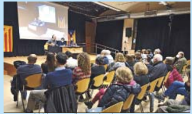
Un moment del debat aquest dimecres a la Sedeta.

L'independentisme està així, aixecant-se de la lona, amb ganes de tornar al carrer i de "constituir el moviment popular", com diu la convocatòria. Més aviat de reconstruir. Al públic li preocupa un pacte Vox-PP a l'Estat o el futur de TV3, però sobretot la