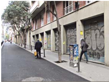
El carrer Verntallat amb Robi és un dels punts a estudiar.

Dimarts a l'Espai Jove La Fontana el col·lectiu Punt 6 d'expertes en urbanisme feminista va exposar el nou projecte, centrat aquest cop a identificar i reforçar l'enllumenat sobre espais que generen inseguretats. "Encara no es