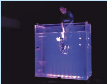
Assaig de l'obra 'El Comte', ideada per l'artista Zamira Pasceri.

Una altra de les obsessions de l'artista és el llenguatge, quin tipus de llenguatge fer servir per sorprendre un públic infantil i també adult, que tothom pugui gaudir de l'obra independentment de l'edat o la llengua que parli. A 'El comte' hi ha música, efectes d'il·luminació, tot està