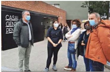
Balanzà, al Casal de Gent Gran de Penitents, dimarts passat.

Esquerra, que no vol perdre punt amb Joanic però que esperarà uns dies després de la reunió del govern amb els afectats, va poder fer final-