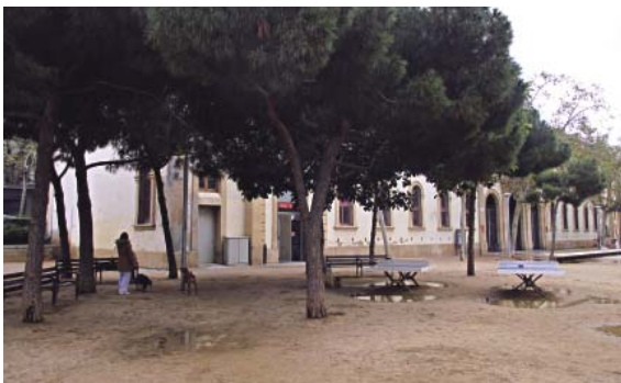
L'espai on s'ha d'ubicar el mercat provisional de l'Estrella, al Parc del Baix Guinardó.

L'Institut de Mercats, en aquesta última reunió d'ara fa 15 dies,