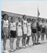
Festiu atlètic el 1935.