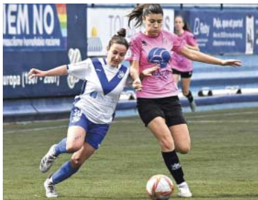
L'Europa s'ha desfet del Riudoms (3-0) al Nou Sardenya.