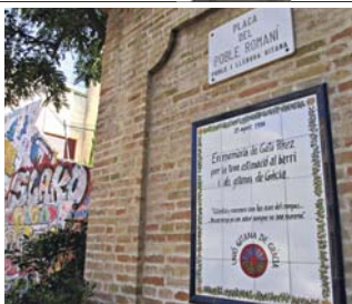
A partir del 8 d'abril es dirà plaça del Poble Gitano. A. G.P.

La celebració a Gràcia serà enguany més especial; descobrirem el nom de plaça del Poble Gitano