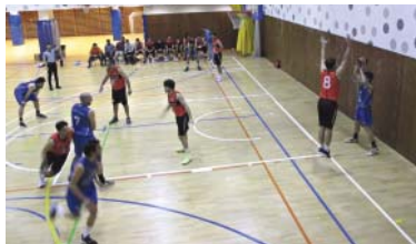
Bàsquet Lluïsos, en un partit de lliga regular al pavelló Comellas.

De la seva banda, el Vedruna, que ha disputat cinc partits el mes de març, ha aconseguit dos triomfs (contra Lluïsos i Ramon Llull),