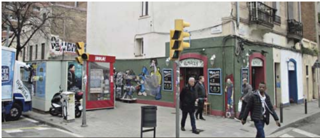
Edificis afectats del carrer Escorial cantonada Ramon y Cajal, a la banda sud de la plaça Joanic.

Les dues parts constituïràn "en tres-quatre mesos" una comissió de seguiment del canvi de Pla General i ja obren un canal de suport a problemes específics del veïnat