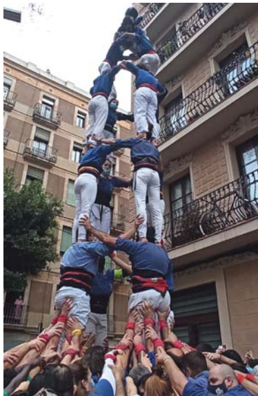
XXXXXX de la Sedeta, en una Festa Major anterior.

La diada de la independència, per la seva banda, s'ha contemplat des de la colla com la primera gran actuació a Gràcia després de la certa velocitat de creuar que s'ha agafat a nivell d'assaigs i ara els blaus ja es veuen amb cor d'aspirar a grans marques anteriors com el 4 de 8. "No l'hem fet des d'abans de la pandèmia, tot i que va ser el més matiner del 2020", explica el cap de colla. A la dia-