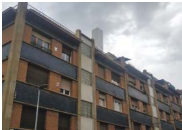
La torre que amaga l'antena 5G, sobresortint del terrat de MDColl 113.

Un centenar de veïns de l'entorn de MDColl 113-115, on s'ha activat l'aparell, es mobilitzen sota l'argument del risc de salut