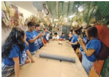
Alumnes de la Universidad Javeriana de Bogotà de ruta festera.

Colòmbia ja va participar a la Festa Major del Bicentenari l'any 2017 a l'Envelat de Jardinetes en l'exposició Guarnir el món de festa. Espai urbà amb la tradicional Feria de las Flores de Medellín, al costat d'altres tradicions similars d'art efímer com les Falles de València o