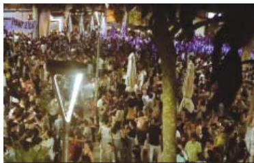
Un nit del passat mes de maig a la plaça Virreina.

Guàrdia Urbana i Mossos, més enllà de les dades de balanç, posen l'accent en la problemàtica actual: el final de la festa a les places