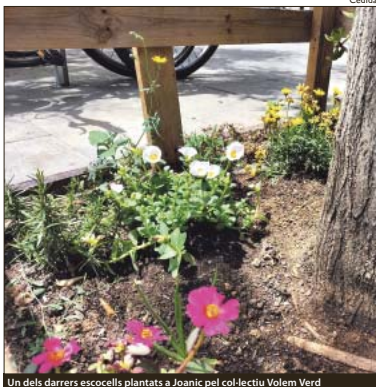
Un dels darrers escocells plantats a Joanïc pel col·lectiu Volem Verd