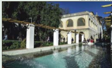
Aula Ambiental Bosc Turull

L'Aula Ambiental del Bosc Turull tancarà la programació per a la ciutadania d'aquest curs amb una visita al parc del Doctor Pla i Armengol, una gran illa de 3.6 hectàrees de verd al barri del Guinardó, que acullen una gran riquesa històrica i natural i que s'ha consolidat com un espai d'especial interès per a la biodiversitat de la ciutat. Durant el recorregut, programat per dimecres 6 de juliol, es descobriren els diferents hàbitats naturals com per exemple el bosc mediterrani, els jardins de plantes aromàtiques, ambients humits al costat de les basses o les feixes agrícoles. A més es podrà accedir al refugi de biodiversitat amb estructures per potenciar la presència de fauna com nius per a ocells i ratpenats, piràmides de fusta per als insectes, i basses naturalitzades per als amfibis.