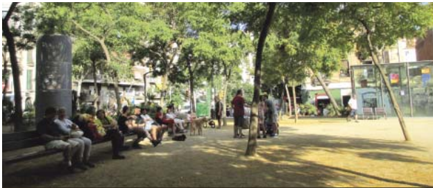
La plaça Joanic, amb els bancs ocupats de veïns prenent la fresca, aquest dijous.

Les denúncies se centren en l'incivisme malgrat els casos aïllats del robatori amb violència a Ramón y Cajal i una agressió sexual a Lesseps