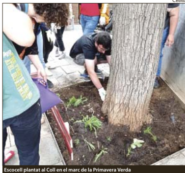
Escocell plantat al Coll en el marc de la Primavera Verda

Sant Joan de Gràcia diumenge 19 de juny. Aquest és la base del projecte: un compromís col·lectiu que mira pel bé comú. Tot i trobar-se amb algunes dificultats i accions incíviques, el col·lectiu segueix amb el manteniment dels escocells plantats, regant i arreglant les baranes. El moviment s'està estenent a d'altres barris. El passat 25 de maig en el marc de la Primavera Verda, el centre cívic i l'Aula Ambiental del Bosc Turull van organitzar la primera plantada d'escocell al Coll (veure el De Verd 175). Ara falta que més persones s'animin a participar de la seva cura. O seguir ampliant el verd urbà amb d'altres escocells. @Eskcells @Goaescocells https://esocells.blogspot.com/