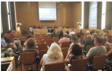
L'audiència pública, a la sala d'actes del Districte, aquest dimarts.

Com a novetat, no obstant això, Badia ha apuntat la possibilitat de prioritzar una ampliació del pressupost en aquest àmbit per fer reversible l'escala mecànica "almenys a primera hora del matí i a última hora del vespre" i a buscar una alternativa d'escala mecànica de baixada "en un altre carrer", en referència al veï carrer Medes.