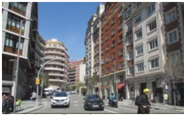
Riera de Cassoles, aquest dijous.

a porta oberta que el Districte va deixar a l'abril als veïns de Riera de Cassoles, comproment-se a buscar una alternativa a la negociativa de TMB d'ampliar els carrils de pujada en diumenge per alleugerir el col·lapse derivat de l'Obrim Carrers a Gran de Gràcia, s'ha tornat a tancar. Així ho va comunicar el regidor de Gràcia, Eloi Badia, a la Plataforma Riera de Cassoles contra la Contaminació Atmosfèrica i Acústica (ex-Plata-