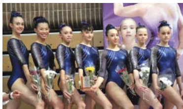
L'equip A de La Salle, disabte passat a Pozuelo de Alarcón.

L'activitat en gimnàstica artística femenina no descansa i dijous 23 arrenca al pavelló Barris Nord de Lleida el Campionat estatal en categoria Base, amb la participació de gimnastes de dos