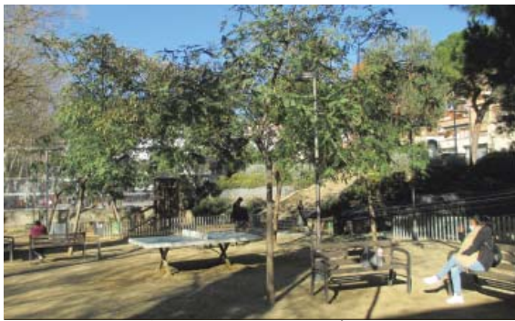
Els Jardins Comas i Llaberia, on està planejat el futur Institut de Vallcarca.

L'abril passat l'Associació de Veïns Vallcarca-Baró de la Barre, que promou el nou pas dels requeriments, ja va presentar en aquesta línia alegacions al projecte del