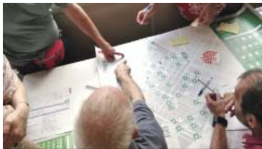
Veïns i tècnics repassant sobre el mapa el pla Cuidem.

Així és que la sessió de retorn no ha servit ni de bon tros per tancar el retrat del pla Cuidem