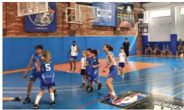
La pista de Lluïsos, a les 12 hores de bàsquet per les festes de l'entitat.

Malgrat tot, l'entitat de la plaça del Nord continua amb el camí obert amb Caves Vallformosa i treballa per tancar acords de contribució econòmica amb més empreses privades. A l'espera que es facin públics els detalls d'aquesta primera entesa, Lluïsos ha fet una