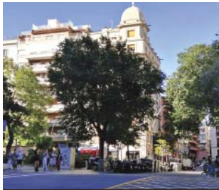
La plaça Galia Placidia, fins on arribarà la L8 del metro.

Després dels assajos de bombament per comprovar el subsòl del març, Territori ja detalla la primera fase d'obra civil que afectarà les línies de subministrament