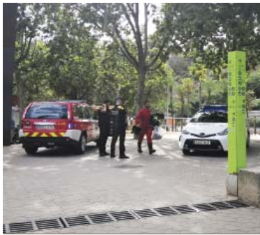
Efectius de Bombers i Urbana, aquest diïlluns al parc de la Creueta.

"És una operació que fem cada dia i ens hem trobat amb l'expulsió de gasos en sec", explica l'operari, després que calgués evacuar 278 persones del recinte pel núvol tòxic