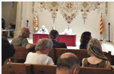
Sessió informativa amb veïns sobre les obres de la L8 del metro.

Territori fixa per a l'estiu de 2023 l'obra del túnel i de les estacions i no descarta la continuació fins a Joanic