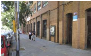
Entrada a l'escola pública La Sedeta, al carrer Sicília.

El projecte és conegut perquè ja es va anunciar que es reduiria el pas a un sol carril de trànsit per avançar cap a la futura superilla. "Es tracta de l'àmbit més compli-