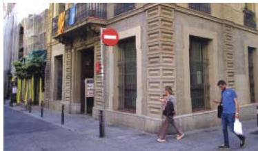
La Violeta celebrarà deu anys com a centre de cultura popular.

Pel que fa a la reobertura del refugi de Revolució, l'informe també apunta entre la tardor del 2022 i el primer trimestre del 2023 es preveu realitzar les tres fases d'actuació: rehabilitació, museificació i arranjament de l'edifici exterior, si bé l'estat de les bigues metàl·liques