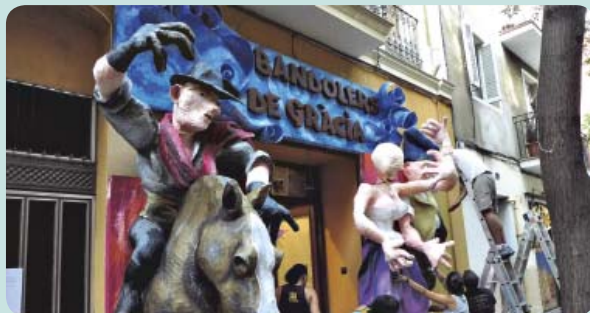
Construcció de la portalada Els bandolers de Gràcia, del carrer de Verdi, 12, el 14 d'agost de 2011, que obtingué el primer premi d'honor.

en el transcurs de la primera meitat del segle XX. El 1999 la Federació Festa Major de Gràcia va recuperar el concurs, en el qual cada any es registren una quarantena de participants. Enguany es torna a convocar per fer que el guarnit, símbol de la festa, arribi a tots els racons de la Vila de Gràcia. A més de contribuir a consolidar una tradició històrica que es manté com un símbol d'identitat de la festa i de passar-ho bé i fer Vila, els participants poden guanyar diversos premis, que van des dels 400 euros fins a lots de productes DO Catalunya.