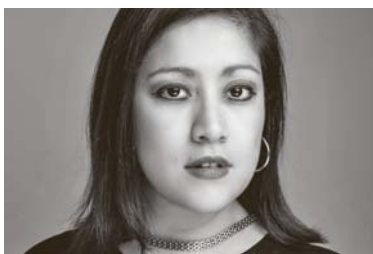
La soprano Ximena Agurto, en una imatge promocional.

La soprano protagonitza el 9 de juliol a Sant Felip Neri el primer espectacle d'un festival que vol "desencorsetar" el gènere líric