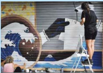
Artista i alumna enllestint la feina.

Els tallers teòrico-pràctics es van realitzar de juny a maig, fonamentalment al Servei Prelaboral Salut Mental Gràcia. Primer es van formar en tècni-