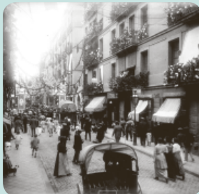
Durant la Festa Major de 1915, gairebé totes les veïnes i els veïns del carrer de Bonavista guarniren els balcons amb flors blanques.

En un principi els guarniments no estaven gaire establerts: podien ser els típics domassos que es posaven als balcons per la processó de Corpus com els guarniments fets amb flors, amb garlandes de paper o amb elements vegetals, un costum que es va prodigar fins ben entrat el segle XX. Es conserva una fotografia força interessant del carrer Bonavista, de 1915, en què tots els balcons estan guarnits amb flors blanques que semblen fetes de paper, tal com recollia El Noticiero Universal . Tot i que era una pràctica popular amb cert arelament, va acabar desapareixent