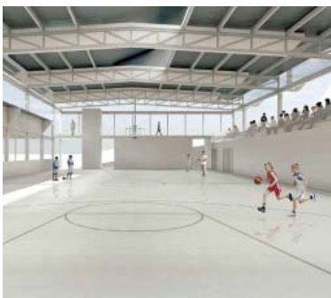
Proposta de tancament de la pista exterior del carrer Castellterçol.

La proposta, pendent en qualsevol cas de la redacció d'un pla especial i d'un projecte que s'executarà en el mandat vinent, preveu "incorporar la pista exterior a les instal·lacions", segons Raboso, i la mesura més important per executar-ho és "mossegant" una part de la muntanya que forma part del