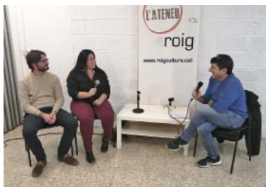
Zaňartu i Hiraldó, ERC, al Passem comptes de l'Ateneu Roig.

Valents, en la primera ronda d'un nou cicle de Passem Comptes, avisa que serà "la gran sorpresa" de les eleccions