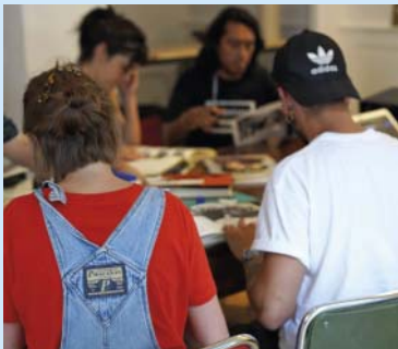
Negra mosca, un nou espai a la Vila per apropar-se a les arts visuals.