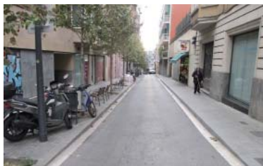
El carrer Maignon, al barri de la Salut, pendent de reforma.

Els veïns, que van reorganitzar-se al juliol un cop es va presentar el pla que preveia eliminar un