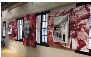
Exposició de fotografies de la Lleialtat al bar del Teatre Lliure.