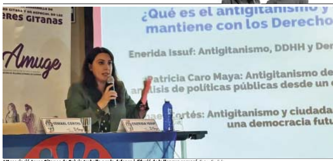
L'Associació Joves Gitanos de Gràcia treballa per la defensa i difusió de la llengua romaní.