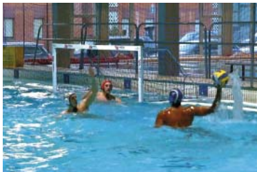
El Catalunya ha caigut contra el 'Medi' (8-12) al primer partit a Horta.

Precisament la formació que entra García es prepara per a un dels desplaçaments llargs de la temporada, contra un nouvingut a la categoria, el Caballa de Ceuta. El Catalunya s'hi enfrontarà dis-