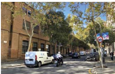
El carrer Sicília, a l'altura de la Sedeta.

I aquí hi ha el segon impacte: Travessera de Gràcia, entre Cartagenes i Escorial, canviarà de sentit i és per on anirà el bus H8. El bus turístic pujarà per Roger de Flor en lloc de Sicília. Aquesta me-