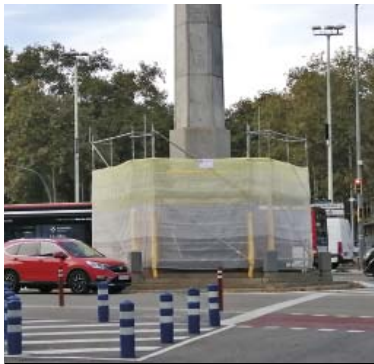
La bastida instal·lada a l'obelisc de la plaça del Cinc d'Oros.

Els nous moviments es complementen amb la cobertura de pèrdues de material per restauracions anteriors ja degradades