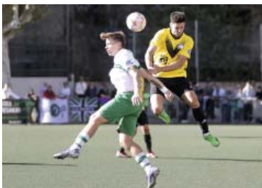
L'Europa ha perdut la imbatibilitat contra el Sants (2-1).

Després de les ensopegades, aquest cap de setmana toca re-