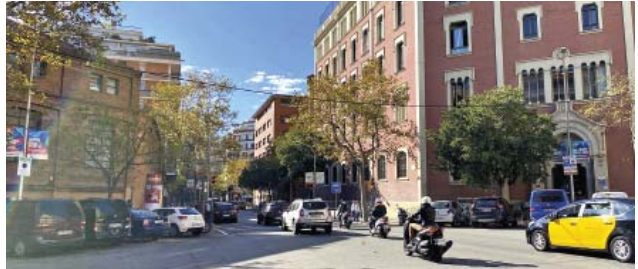
L'encreuament de Pare Claret amb Sicília, on naixerà la gran plaça de confluència dels dos eixos verds de la superilla.

Tal com succeeix en altres fronts de la superilla a la ciutat com Consell de Cent, els futurs eixos verds de Grassot a Pare Claret i Sicília canviaran el sentit de circulació de manera que no es podrà travessar el barri de punta a punta i les funcions de trànsit que feia fins ara Pare Claret des de Lepant a Bailèn passaran a fer-se a Travessera de Gràcia; per tant, Travessera canviarà de sentit. L'impacte dels nous eixos verds també pot suposar una reducció de 371 places d'àrea verda. Pàgina 4