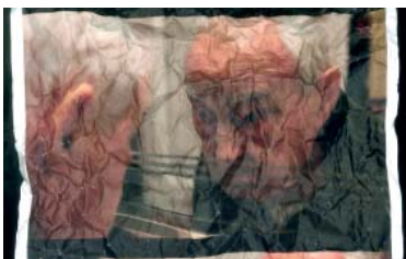
Cartell promocional de la pel·lícula 'Set de Dau. Arnau'.

Arnau Puig va rebre el 2012 el Premi Nacional de Cultura. El jurat va considerar que "com a crític d'art, sempre ha estat al costat