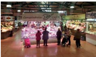
El futur mercat provisional de l'Estrella ha aixecat polèmica.

La tensió no s'ha aturat des que el trasllat va tenir el setembre passat data d'execució per al proper estiu i en el consell de barri d'aquest dilluns -només una mitja menys sacsejat que en l'anterior del 23 d'octubre (vegeu L'Independent núm. 908)- el mínim comú entre veïns crítics i