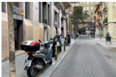
Motos aparcaades a la vorera de Torrent d'en Vidanal.

El pla ha suposat una mitjana de deu sancions i encara registra 625 incompliments al nucli històric