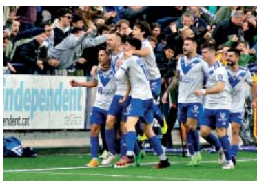
Els jugadors de l'Europa celebrant un dels tres gols del derbi.

I els jugadors van estar a l'alçada de la parròquia escapulada. La