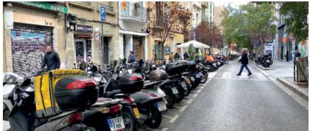
L'aparcament per a motos a Torrent de l'Olla tot complet, aquest dijous.

El tercer intent municipal per embridar l'aparcament de motos al nucli històric de Gràcia ja té primers resultats oficials i aquests es quantifiquen en una reducció de 1.500 vehicles mal aparcats, un 70,6%, passant dels 2.123 incompliments detectats abans de l'inici de la campanya el febrer de 2020 als 624 casos actuals que reconeix el mateix consistori. Després del primer pla de motos l'any 2015, en el mandat Fandos, que es va caracteritzar per crear nous espais senyalitzats fins i tot en carrers secundaris (i no sense polèmica), i el segon pla de motos, més centrat en l'actuació de la Guàrdia Urbana, l'any 2018 en eixos com Via Augusta, Travessera de Dalt, Mare de Déu de la Salut, Gran de Gràcia amb Príncep d'Astúries o plaça del Nord, el tercer pla ha suposat ara una mitjana de deu sancions diàries i afrontarà a partir d'ara una dinàmica que fons municipals han definit com de "manteniment". Pàgina 4