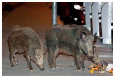
Senglars als barris de muntanya del districte, en una imatge recent.