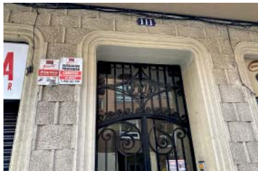
Els veïns de Torrent de l'Olla 111 han denunciat una estafa de lloguer.

La investigació veïnal, que com a conseqüència de la repetició de casos ha dut a posar un rètol a la porta, s'encamina al web immobiliari Pecunia Investment, que ofereix el pis amb fotos presumptament interiors, 850 euros al mes, 54 metres quadrats i dues habitacions. Els afectats han abonat un mes i un altre de fiança per transferència i en cap cas han pogut veure el pis abans. A Gràcia hi ha dos habitatges més: un altre a Torrent de l'Olla (850 euros també) i un tercer a Providència (1.150 euros). Al web,