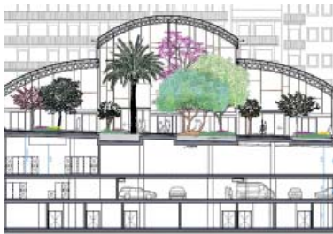
Plànol del projecte executiu, amb el verd dibuixat.

El projecte executiu certifica finalment 45 parades d'alimentació i 10 exteriors, i el pàrquing amb 54 places