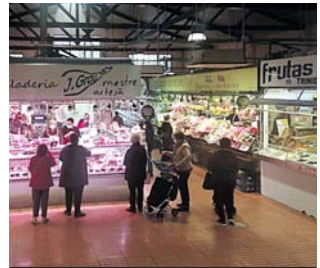
Interior del Mercat de l'Estrella, des del pis de dalt.

La reforma principal, en qualsevol cas, és estructural, i això contempla la reubicació dels paradistes en una carpa provisional que es planteja aixecar al Parc del Baix Guinardó, ja en terrenys del districte d'Horta-Guinardó, al voltant del quadrant que formen els carrers Lepant, Sardanya, Taxdirt i Travessera de Gràcia. L'Institut de Mercats, segons fonts coneixedores del contingut de l'última reunió, ha explicat que les obres no han de ser immediates però que s'han de programar i executar a curt termini per qüestions de seguretat. Pàgina 4