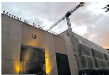
El Mercat de l'Estrella, per la banda de Providència.

L'Institut de Mercats detecta patologies greus a l'edifici després que una promoció de pisos detectés fuites i es fessin unes cates