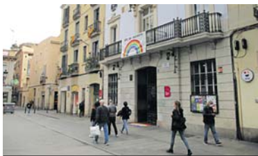
La seu del Districte, a l'espera de la bastida per les noves obres.

El projecte de restauració no només se centra en la consolidació i la restitució dels elements de pedra amb escuts, esgrafians i relleus