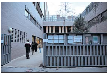
Entrada a l'escola L'Univers, en una imatge recent.

Aquesta és una de les principals conclusions de la reunió que, numèricament, a la vista de la documentació presentada pel Consorci, apunta que d'un any per l'altre hi ha hagut prop de 300 matrícules menys (-297) sobre les més de 12.000 (12.130) que hi ha