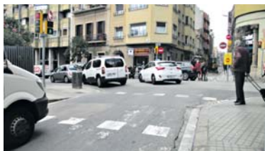
El carrer Ballester amb República Argentina, amb les obres al fons.

a reforma del carrer Ballester, tradicional bypass de sortida de Gràcia des de l'avinguda Vallcarca cap a Mitre atenuat en els últims anys pel canvi de sentit des de República Argentina, ha arrencat les obres de pacificació i aquest dimarts ha concretat detalls en les tres fases que es desplegaran fins al juny de 2022. Les obres, que no afecten el tram inicial entre Vallcarca i República Argentina però sí tota la