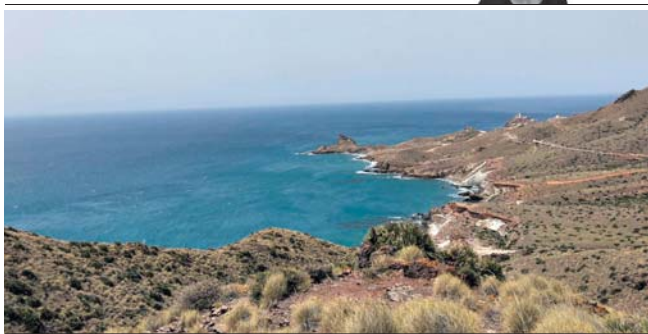
La vista es perd entre la costa imponent i salvatge del parc natural de Cabo de Gata, Almería, i el mar Mediterrani.