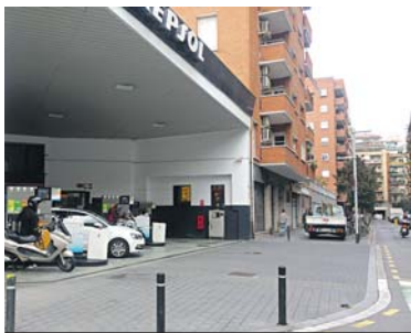
Benzinera, a Legalitat amb Ca l'Alegre de Dalt, propera a l'escola.

posa de llicència d'activitats en regla i no hi ha hagut incompliments en les inspeccions que s'hi han fet. En tot cas, si que l'Ajuntament s'obre a seguir fent inspeccions i a minimitzar el risc de la interacció entre els vehicles que hi entren i hi surten i la comunitat educativa. Aquest divendres, en tot cas, tornen les manifestacions de #RevoltaEscolar i coincidirán a Lesseps amb les de #Elfumemsmata. ●