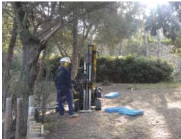
Operaris treballant a l'extrem del Coll del Portell aquesta setmana.

desembocar en un espai d'activitats i un jardí amb un lavabo-bar. En el nou mandat s'hi construirà un annex i el vial de connexió entre el pont i el carrer Becquer. Però l'altre gran punt de debat veïnal i reconstruït serà el Parc Central de Vallcarca, l'espai en forma de cunya que va des del pont al barri antic i que ja va formar part del concurs d'idees i del document d'autoria veïnal. "Aquestes aportacions anteriors funcionaran com un avantprojecte del procés participatiu sobre la urbanització que farem a la tardor", han apuntat els tècnics. "Necessitem desplegar aquest dibuix", ha afegit Badia. La tramitació tornant de l'estiu, a més del procés participatiu, inclourà la licitació de la redacció del projecte executiu, que avançarà en paral·lel sumant les aportacions veïnals. També es dona per fet el trasllat de la pista de bàsquet, perquè ja estan adjudicades les dues primeres promocions públiques de 56 pisos en règim cooperatiu a Becquer i de lloguer aavinguda Vallcarca (on hi ha la pista).