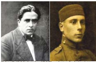
El pintor Picabia i el voluntari republicà Villar, en imatges d'arxiu.

Albert Balanzà El procés de recuperació de la memòria històrica i d'homenatge a personatges socials i polítics que han tingut relació amb Gràcia està a punt de viure en les properes setmanes dues noves incorporacions destacades, les quals arriben de manera col·lateral als treballs que fa el grup de treball de Nomenclàtor. Es tracta del pintor parisenc Francis Picabia, referent del dadaisme, i de Lluís Villar, voluntari republicà deportat a Argelers i a Mauthausen. La incorporació de Picabia es concreta a partir de les propostes que l'Institut de Cultura (ICUB) analitza en el marc del programa Barcelona Ciutat de la Literatura i serà el 8 de juny quan es describrà una placa a la casa on va viure a l'avinguda República Argentina 28, a tocar del carrer Ballester. Es dona la circumstància que l'última acció d'aquest programa municipal a Gràcia ja va tenir relació amb aquest carrer, quan Joan Peruchó va ser honorat també amb una placa a la casa de la república Argentina 248 el passat octubre. La història del reconeixement a Lluís Villar és més llarga i es vincula al projecte internacional de llambordes d'honor Stolpersteine, dissenyades per l'artista alemany Gunter Demnig en record dels de-