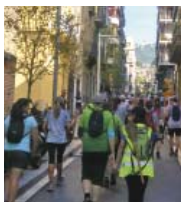
Sortida de la Directa Tibidabo.

Un cop disputada la primera edició de la Directa Tibidabo, el Club Excursionista de Gràcia continua amb les activitats previstes del centenari. Precisament dilluns 23 es realitzarà la recepció oficial al Parlament, un acte de commemoració dels cent anys de l'entitat que es va haver d'ajornar al gener. En l'apartat esportiu, la prova més propie-