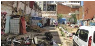
Imatge actual del solar de Jaén 12.

A.B. A l'estiu tota cuca viu i la calorada i la falta d'higiene en el solar de Jaén 12, on fa tres anys la promotora Norvet hi volia fer apartaments de luxe, ha envaïent les rates, que ja surten de nit al carrer. Lluny queda aquella idea de fer dos grans flats: "Each townhouse spans 35 m 2 (interior) & 48 m 2 (outdoor) over three floors. Jaén includes