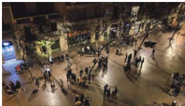
Ambient nocturn a la plaça Revolució, en una imatge recent.

La plataforma, formada per les places Diamant, Revolució, Virreina, Nord, Sol, Lennon,