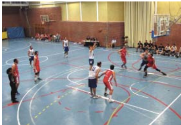
El Claret ha encaixat una derrota a casa contra el Santa Coloma (52-59).

El senyor A masculí del Claret té com a objectiu assegurar la segona plaça que certifiqui continuar una temporada més a Copa