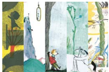
Cartell de la mostra sobre il·lustració infantil que acull El Culturista.

La següent activitat que ha programat El Culturista és una conversa amb Jutta Bauer, divendres 27 de maig a les 18h, per parlar sobre els processos creatius que es donen a l'hora de crear per a la infància.