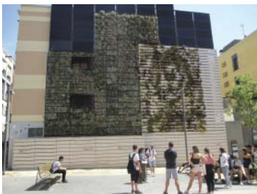
Mural a Dones del 36 amb la figura de la miliciana Marina Ginestà.

La traducció és la introducció de vegetació mínima per compensar qualsevol obra nova o gran rehabilitació. En una escala de 0 (asfalt) a 1 (bosc), l'IDEEU es planteja en els carrers de xarxa bàsica (0,18) i superior als carrers secundaris residencials (0,33). A parcs i places s'eleva a 0,36-0,68 i en parets mitjaneres 0,23 com jardins verticals),