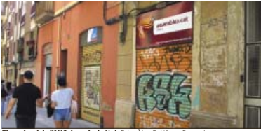
El nou local de l'ANC, ja amb el rètol.

A.B Des del febrer l'ANC ha estat feintant en el nou i cèntric local de Francisco Giner 43 amb el qual vol rellançar l'organització a Gràcia i fer tornar a sortir la gent al carrer, com en els grans temps de les mobilitzacions independentistes de no fa pas tant i quan encara es manté la trobada pels presos i exiliats cada dilluns a plaça