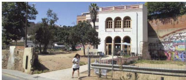
Can Carol, esperant la urbanització de la plaça Farigola, que estarà en obres després de l'estiu i fins a principis de 2023.

El Districte anuncia un nou procés participatiu a la tardor per a la urbanització del Parc Central mentre es redacti el projecte executiu