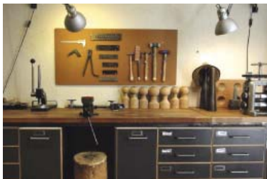
Taller Perill, dedicat a la joieria contemporània, present als Tallers Oberts'22.

Les jornades de portes obertes, del 21 al 29 de maig, sumen més espais de creació: Gràcia passa de 22 a 36 participants