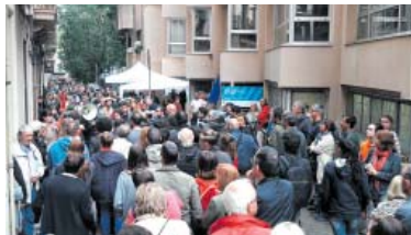
L'escola Reina Violant, el matí de l'1-O de 2017.

— Els col·lectius independentistes de Gràcia organitzats al voltant de GràciaRepública i Gràcia Llibertat preparen el cinquè aniversari de l'1 d'Octubre amb una concentració a la plaça del Poble Gitano per a la qual comptaran dissabte de la setmana que ve amb una acció que es desplegarà al migdia a partir d'un poema d'Enric Casasses. Així ho han explicat els organitzadors, que