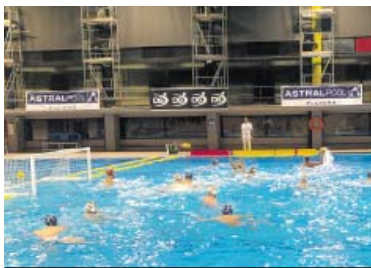
El 'Cata' masculí se les haurà amb el Barcelona a la Copa Catalunya.