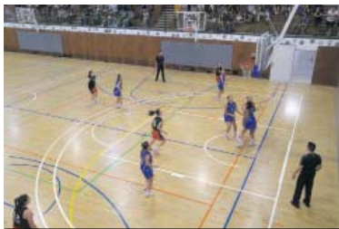
Lluïsos ha superat el SaFa Claror a la final femenina del Vila de Gràcia.

El darrer en començar la competició serà el senior A masculí