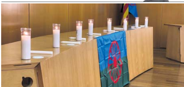
El passat 2 d'agost a la sala de plens del Districte es va encendre una espelma per cada un dels col·lectius perseguits pel nazisme.