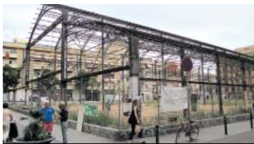
L'estructura metàl·lica de l'Abaceria, aquesta setmana.

Després de l'Ajuntament envia a final d'abril una primera carta d'avis als veïns sobre les inspeccions tècniques que es farien "durant els propers mesos", amb el nom de l'empresa que farà aquests contactes, ara una segona carta ja dirigida als mateixos veïns per part dels seus administradors