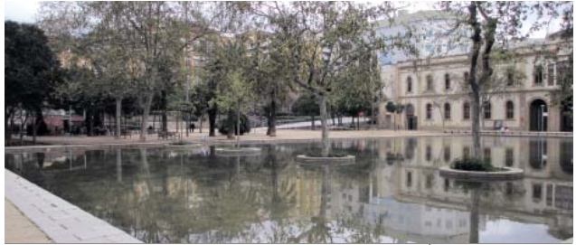
El mercat provisional de l'Estrella s'ubicarà en un espai arran del llac del Parc del Baix Guinardó.

Ara ja amb la situació controlada i amb el calendari activat per començar a la primavera les obres d'aixecament del mercat provisional, els detalls ja estan clars: els comerciants encara viuran el Nadal al mercat original, el futur equipament s'assentarà en un espai arran del llac al parc i sobre una illa d'un metre d'alçada, hi haurà 25 arbres afectats i en paral·lel s'eliminarà dos terços del llac per fer-hi una plaça, com s'ha apuntat en els pressupostos participatius. Pàgina 4