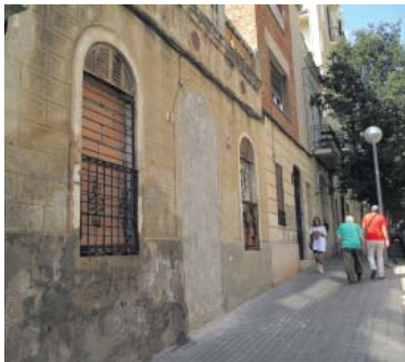
La històrica casa okupada de Montmany 3, aquest dijous.

La negociació entre propietaris i Ajuntament, però, no s'acaba aquí: els primers es queixen de