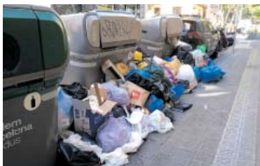
Acumulació de brossa a tocar de Pi i Margall, a Sant Lluís amb Alegre.

Hi ha molts elements col·laterals amb aquest aterratge als Jardins del Baix Guinardó. En primer lloc, l'afectació als arbres de l'espai elegit, amb uns 25 exemplars, sobretot pins amb poca salut, que es reposaran. També, d'acord amb els pressupostos participatius d'Horta-Guinardó, la reforma del llac, que s'eliminarà en dos terços per esdevenir una plaça i amb el 7% restant per acollir jocs d'aigua. ●