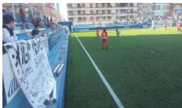
Pancarta contra la invalidació de firmes diumenge al Nou Sardenya.

De la seva banda, el primer equip femení se centra en el proper rival a Segona Federació, el Saragossa, que ja va eliminar a la Copa. La tercera jornada de lliga es disputarà dissabte 1 d'octubre (20h) al Nou Sardenya. Les escapulades descansaran aquest cap de setmana, després de golear el Frial a domicili (2-4) amb gols de Fati (2'), Pili Porta (39'), Andrea Porta (70') i Queralt (89').