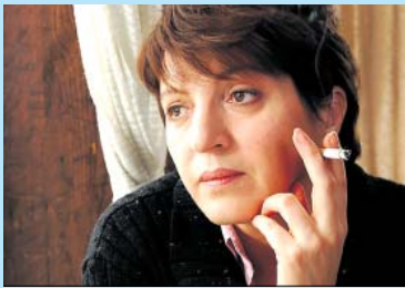
Fotograma del film 'Grbavica', que inspira l'obra de teatre 'Sarajevo'.

Així doncs, no serà amb una comèdia ni amb un musical sinó amb un espectacle promès que el Cercle de Gràcia arrencarà la temporada de teatre el 21, 22 i 23 d'octubre: 'Sarajevo', una obra largament pensada, la primera que escriu original sobre un conflicte bèl·lic concret. "Durant els meus anys com a mestra a l'escola he fet servir la història adaptada al teatre per tractar diversos temes, com ara la guerra civil, la segona guerra mundial o el nazisme, però al Cercle és la primera vegada que escriu i dirigeixo una obra així", confessa Sesé.